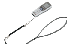
● 颈带 OP-87163