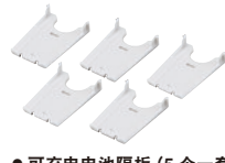
● 可充电电池隔板 (5 个一套) BT-A15